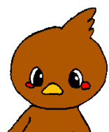
本校マスコットキャラクター「はちゅかりん」