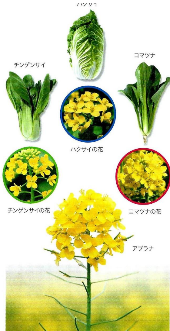
▲図1 アブラナのなかま 葉などの形は多様だが、花の色

●● アブラナのなかまに共通の特徴とは何だろうか 私たちの身のまわりをよくみてみよう。生物の多様性と共通性の一端をみることができる。アブラナのなかまは、野菜や油の原料として、私たちが利用している植物である。チンゲンサイやハクサイ、コマツナは、すべてアブラナから品種改良された野菜である(図1)。これらの野菜は葉や茎の形が多様であり、一見して同じなかまであることがわからないほどである。しかし、これらの野菜を「花のつくり」に着目して観察してみると、花卉の色やつき方が共通しているだけでなく、がくの数 いくつ は4、花卉の数 いくつ は4、おしべの数 いくつ は6、めしべの数 いくつ は1となっていて、すべての花で共通している。このような特徴は、アブラナのなかまの植物に共通する特徴(共通性)である。