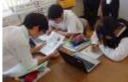
総進の授業風景 (未来を拓く「学び」推進 事業の研究授業より)