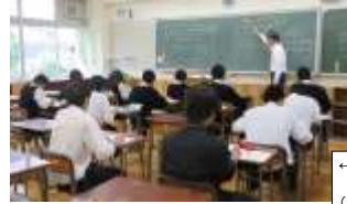
←総合進学クラス 数学授業風景 (習熟度別少人数)