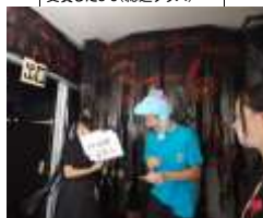
H29初雁祭で「初雁大賞」を 受賞した3-6(総合進学クラス)