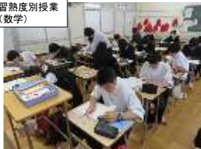
習熟度別授業 (数学)